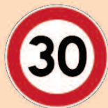
Panneau de type B14

Le panneau de limitation de vitesse de type B14 ne s'applique que sur l'axe sur lequel il est implanté jusqu'à un panneau modifiant cette prescription.