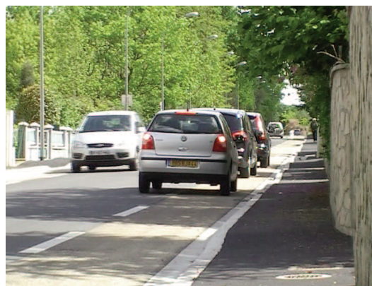
Exemple de chaussée à voie centrale banalisée en milieu urbain

En effet, les véhicules motorisés sont, par défaut, autorisés à circuler (pour se croiser), s'arrêter et stationner sur la rive.